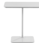
Coalesse Lagunitas Personal Table HOCOLAGTP01 (Milch) HOCOLAGTP02 (Schwarz)