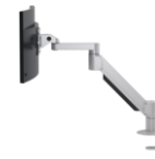
Steelcase FSMA Evo Monitor Arm HOD57EVO01 (Silber) HOD57EVO02 (Weiss C-Klemme