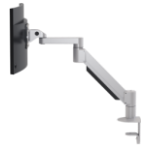
Steelcase FSMA Evo Monitor Arm