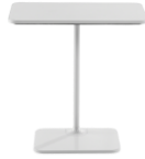
Coalesse Lagunitas Personal Table