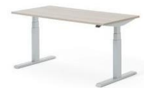
Steelcase Migration HON6B108260001 Desk electric H720-1200 Wi1400 x D800mm