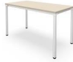
Steelcase Kalidro Desk